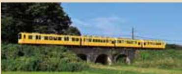
協賛：西美濃・北伊勢観光サミット