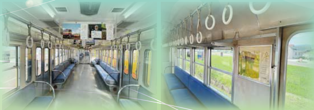
ギャラリートレイン