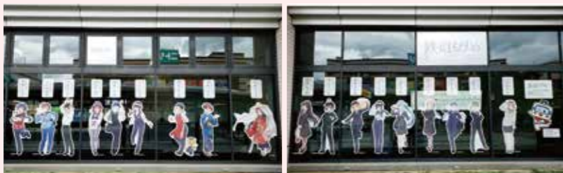
コラボ企画 鉄道むすめミュラール