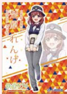
キラキラクリアファイル